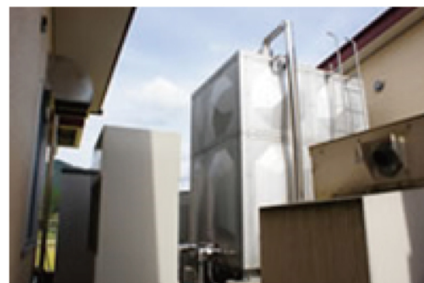
エコキュート 室外機と貯湯槽