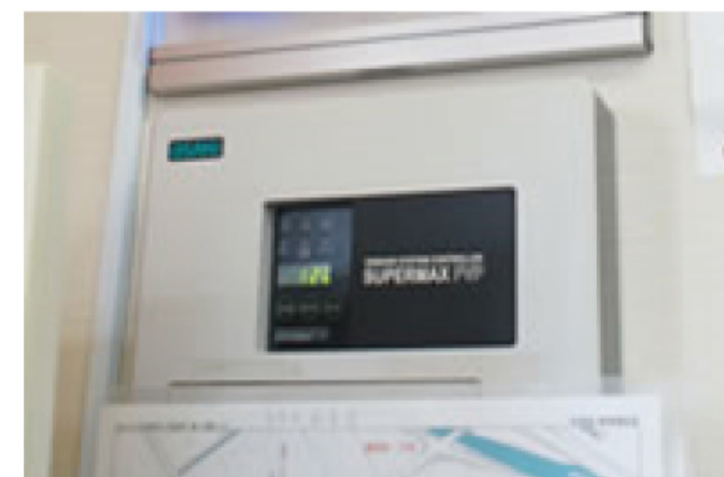
デマンドコントローラー