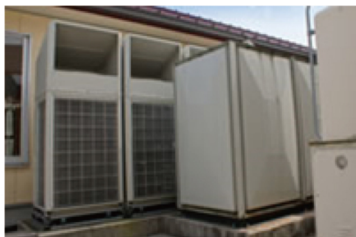
エコアイス 室外機と蓄熱槽